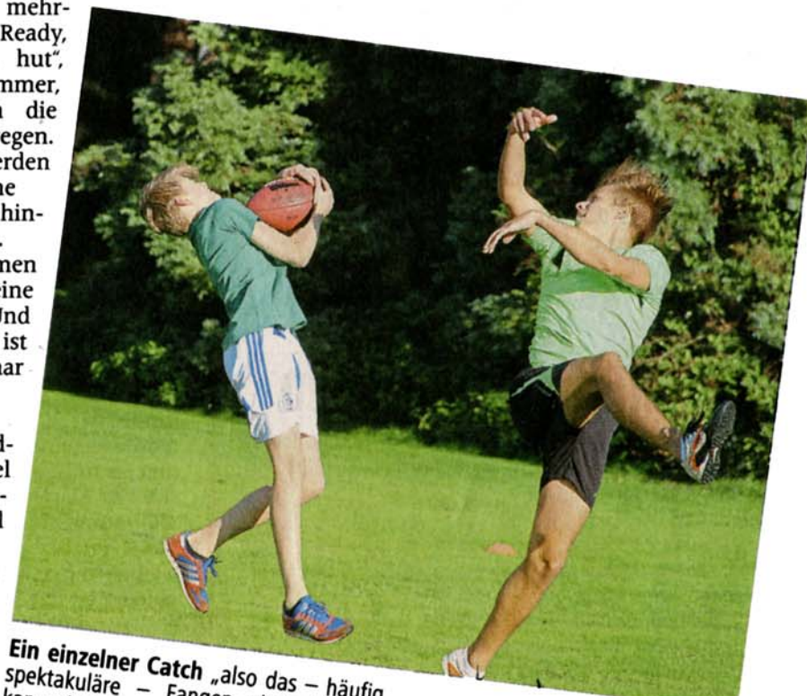
Ein einzelner Catch „also das – häufig spektakuläre – Fangen eines Balles“, kann eine ganze Partie entscheiden.