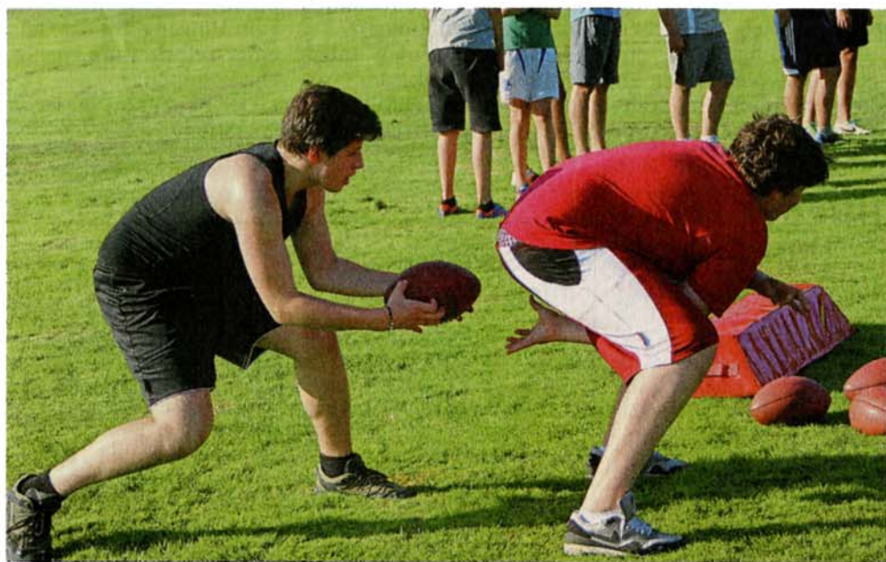
Die Ballübergabe an den Quarterback muss passen, sonst ist der Spielzug frühzeitig zum Scheitern verurteilt.